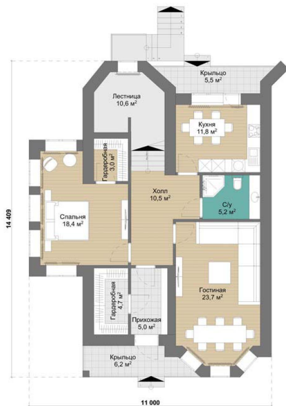
План 1-ого этажа