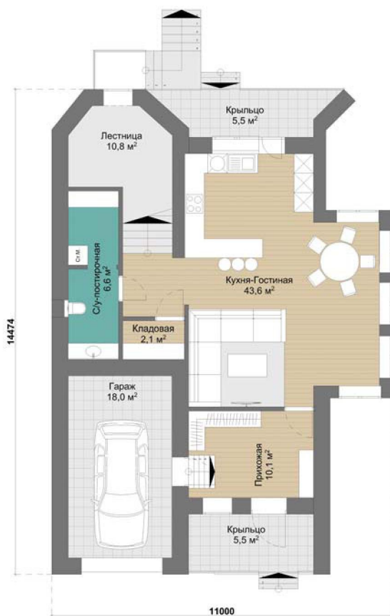
План 1-ого этажа